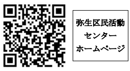
弥生区民活動センターホームページ

編集・発行 弥生区民活動センター 運営委員会 中野区弥生町1-58-14 TEL 3372-0845 FAX 3372-0846