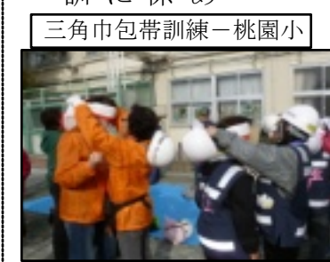
三角巾包帯訓練-桃園小