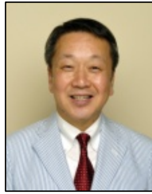
中野区長 田中大輔