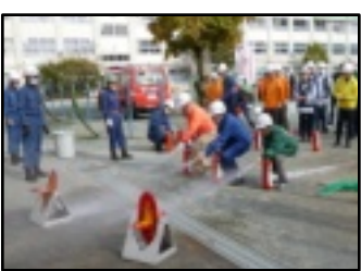
初期消火訓練-桃園小