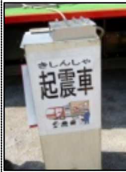
医師の救急医療説明-二中

十一月に二中と桃園小 で防災訓練が実施されま した。東日本大震災が 記憶に新しいなか、多くの 参加者が真剣に訓練に取り 組みました。二カ所共通の 訓練は初期消火訓練・救出 救助訓練・起震車訓練でし たが、その他三角巾包帯訓 練・避難所見学・ 練習・避難所見学・ 備蓄倉庫見学等があ りました。日赤関係 者も炊き出し訓練に 参加して充実した訓 練となりました。