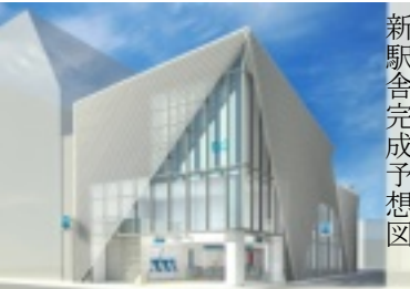
新駅舎完成予想図

弥生地域住民の長年の要望であった中野新橋駅のエレベーター設置が、ようやく実現することとなりました。東京メトロ発表では、既に行われている土木工事に続き、エレベーター設置や駅舎建設を含む駅舎建設工事が行われ、竣工は平成二十六年六月末の予定です。