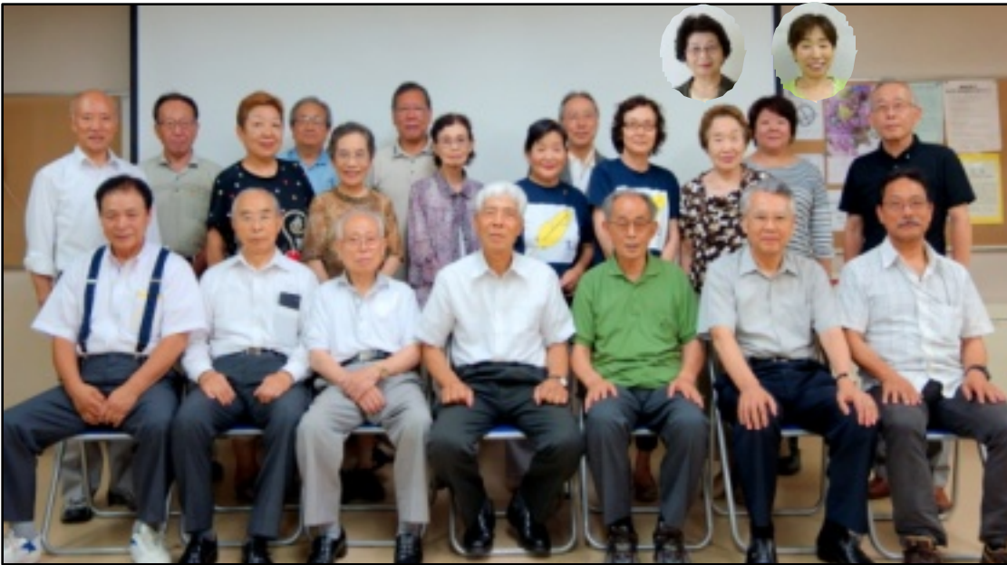
運営委員会メンバー（運営委員 20名 事務局 2名）

編集・発行 弥生区民活動センター 運営委員会 中野区弥生町1-58-14 TEL 3372-0845 FAX 3372-0846