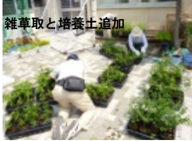
雑草取と培養土追加

又、昨年に引き続き植樹ボランティアも十月に予定していましたが、台風の襲来で延期となり、十一月十七日に弥生地区町会連合会と地区委員会ミニ・リーダー研修との共催で実施の予定です。