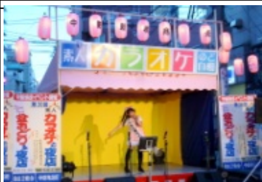
設置され、素敵な駅となりました。毎年夏祭りに行われている中野新橋商店街主催のカラオケ大会

商店街の中心を流れる神田川では、川幅を広げる工事を進めています。駅前通りまで終了し、改装した橋の名前も新橋から中野新橋と改称してもらいました。 又、中野新橋駅もリニューアルされ、エレベーターも設置され、素敵な駅となりました。 毎年夏祭りに行われている中野新橋商店街主催のカラオケ大会