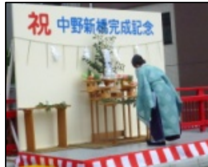
祝 中野新橋完成記念

三十一回目を迎える予定で申込者も多く、観客と一体となり盛り上がりも増えています。