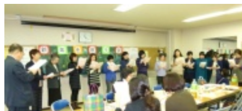
た。また、地元四小中学校の校歌を出身者が斉唱しました(写真)。

た。また、地元四小中学校の校歌を出身者が斉唱しました(写真)。 ◎その他、やよいボランティア「向寿会」の新年会も開催されました。