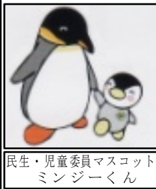
民生・児童委員マスコット ミンジーくん