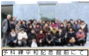
予科練平和記念館前にて

◆二月二十四日、日赤弥生分団で日帰りバス研修が開催されました。今年も総勢四十一名が参加し、茨城県阿見町の予科練平和記念館を見学し、平和と命の大切さについて学びました。多くの参加者から、来年もぜひ開催してほしいとの声が多数上がりました。