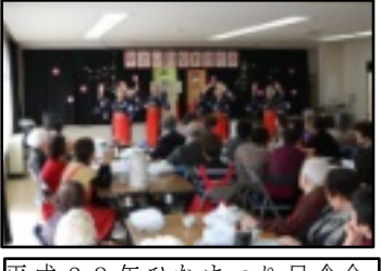
平成28年ひなまつり昼食会

本会は、弥生地域に住む全ての人々が、安全で安心して暮らせるようにしようと、一九九二年六月に発足しました。役所、社会福祉協議会、民生委員、町会等の方々のご指導・ご協力のもと、自主的参加の協力会員は年々増え、現在は一〇〇名近くが活動に携わっております。日頃は、地域にある幾つかの高齢者施設への応援という地味な活動から、区民活動センター集会所での歌やゲームを取り入れた軽体操とおしゃべり、そして「たなばた」「クリスマス」「ひなまつり」という季節の行事に合わせた会食会は、会員手作りの昼食と、地域の方々の演芸とが好評で、楽しい交流の場となっております。