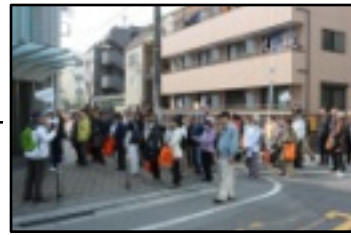
ウォーキングの様子

三月六日(日)に運営委員会主催の七町会ウォーキングが開催されました。幸い当日は事前の予報とは違い、薄日も射す、まずまずの天気となりました。